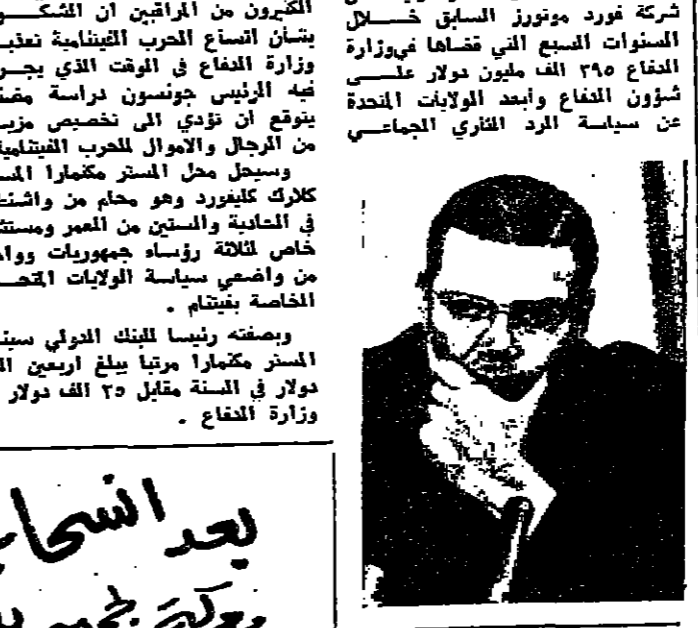
واشنطن - رويتر - انسحب المستر جورج رومني حاكم ولاية ميشيغان من السباق على ترشيح الحزب الجمهوري لانتخابات الرئاسة في الولايات المتحدة

واشنطن - رويتر - نحاى المستر روبرت مكمكرا وزير الدفاع الامريكى امس عن منصبه كرئيس اكر مؤسسة عسكرية في العالم ليكرس وقته للامام الاقتصادي السلمي وسيتولى المستر مكمكرا اندي يبلغ من العمر ٥١ سنة والذي يملك عقلا سرعما كاتلة الحاسبة منصبه الجديد كرئيس للبيك النووي بعد اجازة سنس شهر واحد وقد اتفق المستر مكمكرا ورئيس شركة فورد موتورز السابق خليل السنوات السبع التي قضاهها في وزارة الدفاع ٢٥٥ الف مليون دولار على شؤون الدفاع وابدع الولايات المتحدة عن سياسة الرد القاري الجماعي